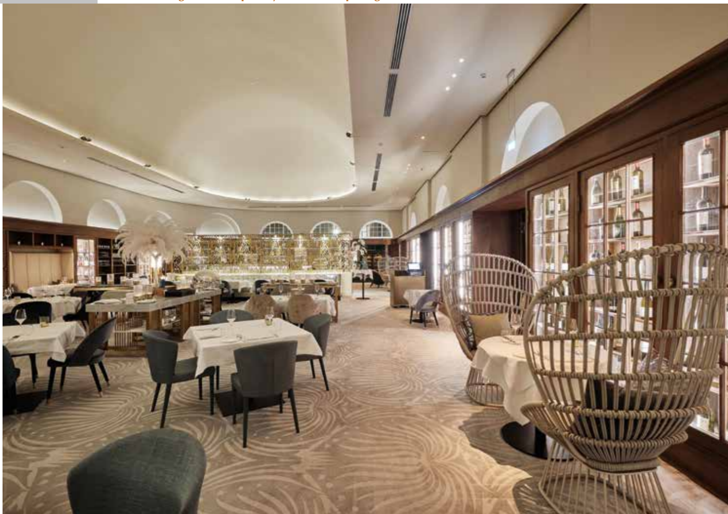
Kulinarische Zeitreise in die 1920er Jahre – der Dining Room im Fraser Suites Hamburg. Viele der Merkmale der einstigen Oberfinanzdirektion wurden bewahrt, wie etwa große Eichentüren, die den Regalen und Vitrinen ein Gefühl der Größe verleihen.