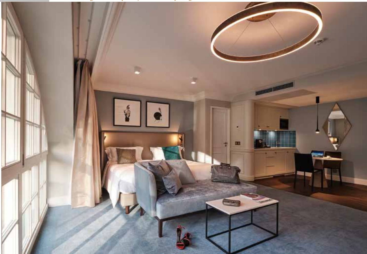
Reisende, die Luxus suchen, haben die Qual der Wahl – vom Deluxe Zimmer mit Kingsize Bett bis zur Premier Suite mit separatem Schlafzimmer gibt es Optionen für alle Bedürfnisse, für Kurzurlaube oder längere Aufenthalte.