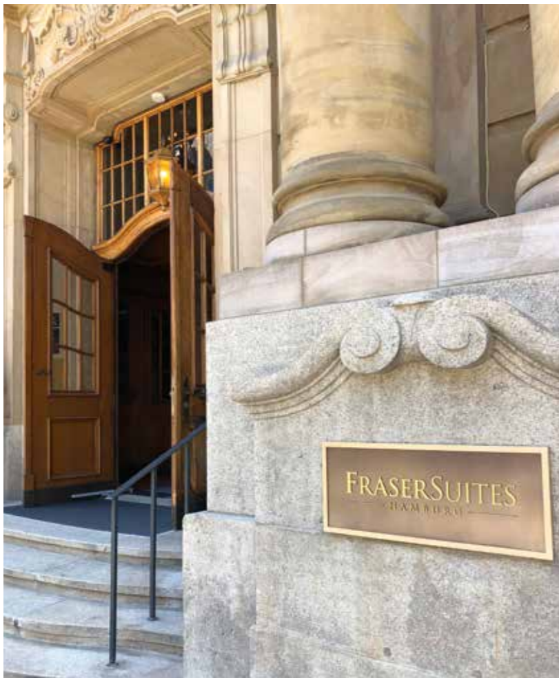
Das Fraser Suites Hamburg – ein luxuriöses Refugium mit zeitloser Eleganz.