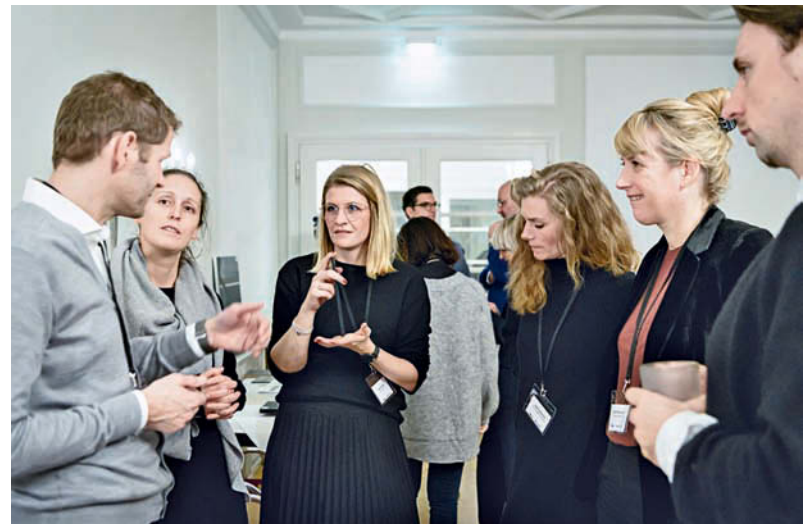
Allgemeines Fazit: ein informativer Nachmittag, der ganz im Zeichen der Oberflächenpotenziale stand.