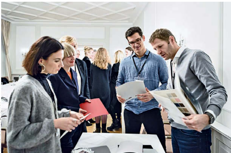
Anschließend gab es die Gelegenheit, sich untereinander intensiv über das Gezeigte auszutauschen.