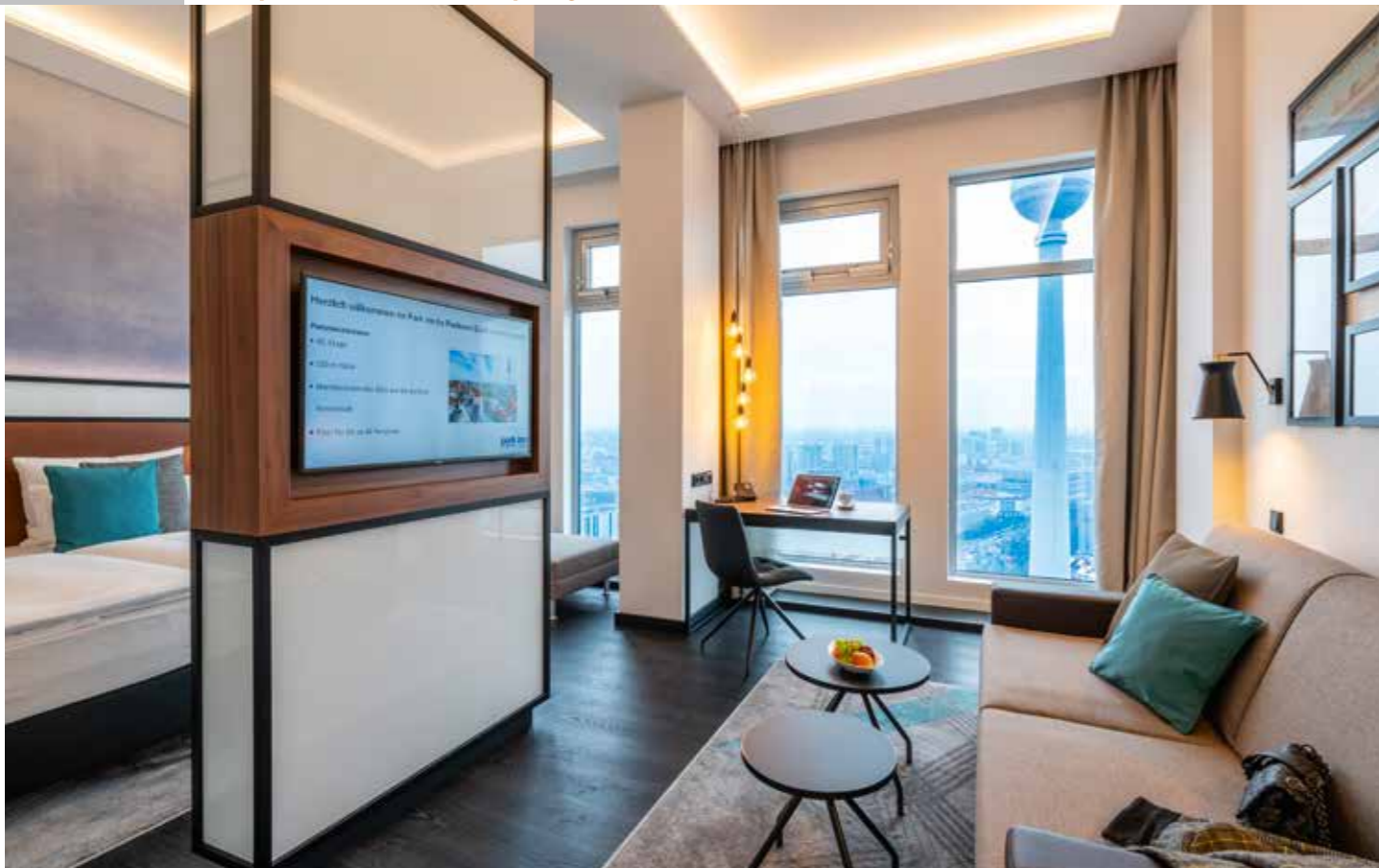
Endloser Komfort hoch über Berlin – die exklusiven Skysuiten in der 37. Etage des Hotels Park Inn by Radisson eröffnen dank bodentiefer Panoramafenster einen imposanten Ausblick in 110 Metern Höhe über die deutsche Bundeshauptstadt.